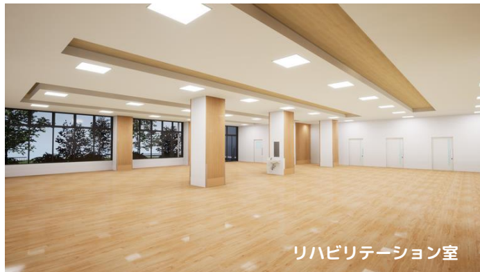
リハビリテーション室

荻原記念病院はリハビリに力を入れています。入院当日から担当医療スタッフとの顔合わせ、身体機能の評価を行います。入院中は1日1～3時間のリハビリを実施し、身体機能の再学習、生活の再構築、人生の再出発を目指し、最大限のリハビリを行います。