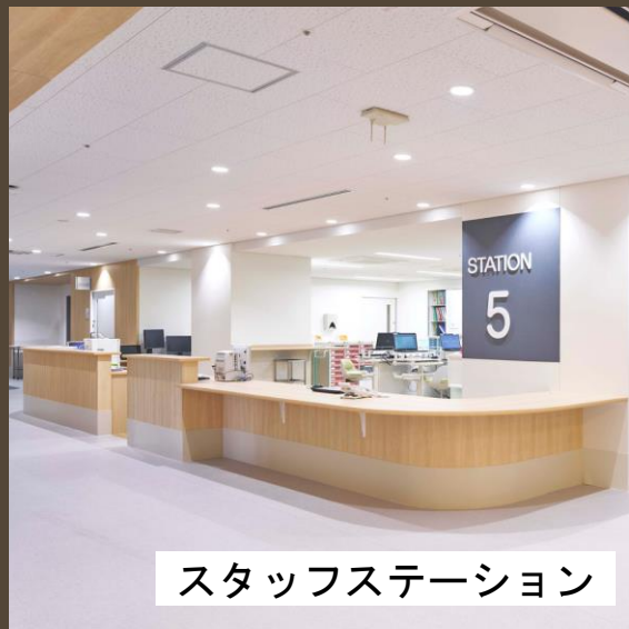
スタッフステーション